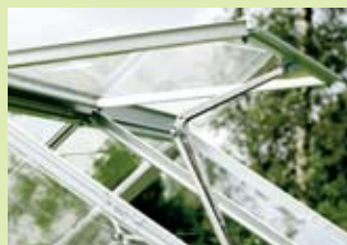
Ekstra takvindu og automatisk vindusåpner