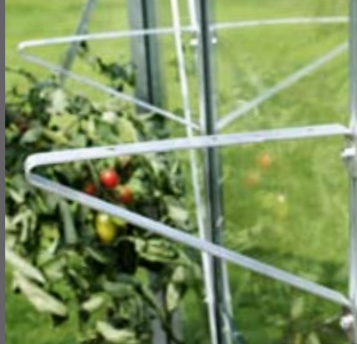
Hyllekneker 2stk. inkl. skrue og mutter