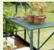
Veksthusbord m/ ekstra hylle