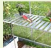
Topp til veksthusbord