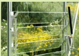
Sjalusivindu og automatisk sjalusivindu