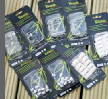
Klips, skruer og muttere. Oppbindingskroker m.m.