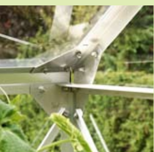
Hjørnesamling i Uranus

Et stort veksthus kan kombineres som en liten utestue og veksthus.