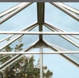
Takstivere til Uranus

Et stort veksthus kan kombineres som en liten utestue og veksthus.