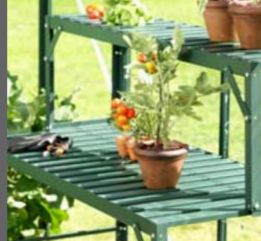
Topp aluminiumbord – her i grønn utgave